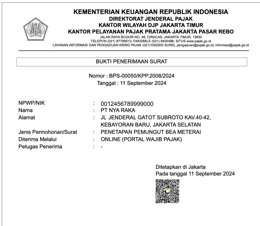
Gambar 7 CONTOH BUKTI PENERIMAAN SURAT